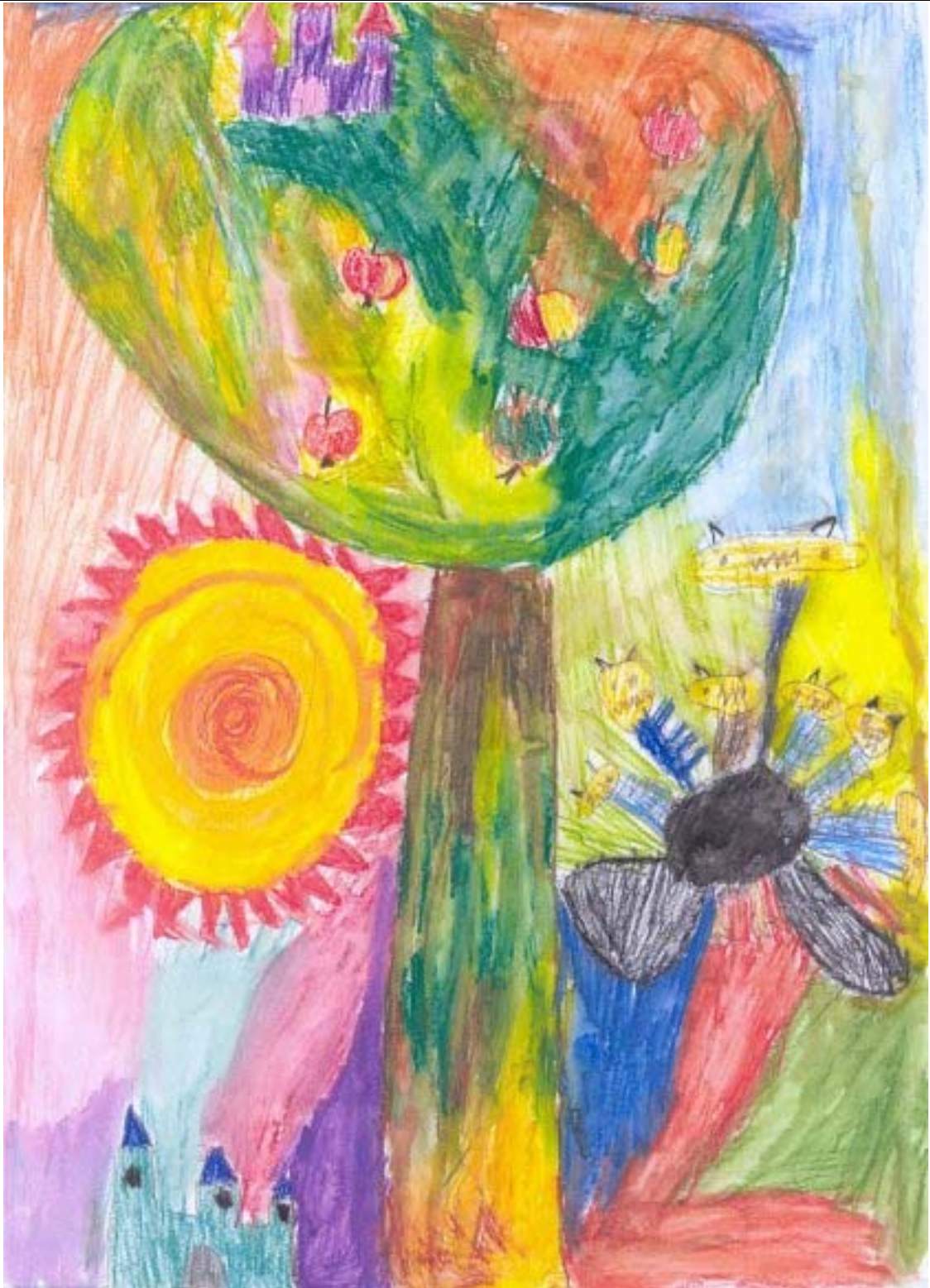
LIPTAI JENIFER (6 éves) Bogádmindszent